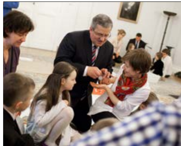
Spotkanie Prezydenta RP z dziećmi przed debatą „W trosce o Najmłodszych Obywateli RP”, 25 kwietnia 2012 r.

ustanowienie kwoty wolnej od podatku uzależnionej od liczby dzieci w rodzinie i zastąpienie nią obecnego sposobu obliczania ulgi na wychowanie potomstwa; wzmocnienie samodzielności mieszkaniowej młodych rodzin przez wprowadzenie kompleksowej polityki mieszkaniowej dla osób o różnej zamożności; zorganizowanie czasu pracy w sposób przyjazny rodzicom; wprowadzenie elastycznego i prostego systemu urlopów związanych z opieką nad małym dzieckiem; zwiększenie dostępności do instytucjonalnej opieki nad małym dzieckiem m.in. poprzez wprowadzenie górnego limitu wysokości opłaty rodziców za opiekę w żłobkach i klubach dziecięcych. Wśród postulatów z zakresu polityki rodzinnej zgłaszanych przez Prezydenta warto wymienić również propozycję stworzenia ogólnopolskiej karty dużej rodziny.