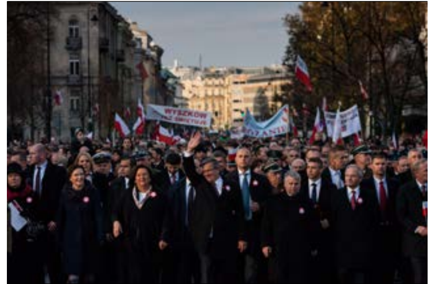
Para Prezydencka na czele Marszu „Razem dla Niepodległej”, 11 listopada 2012 r.