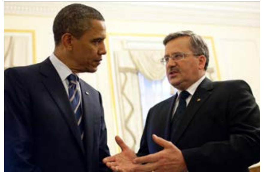
Wizyta Prezydenta Baracka Obamy w Polsce, 27 maja 2011 r.