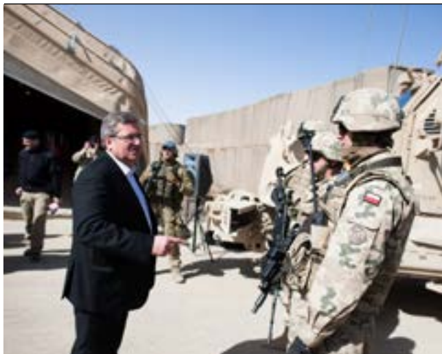
Spotkanie z żołnierzami 10. Zmiany Polskiego Kontyngentu Wojskowego, 6 marca 2012 r.

ochronnej, społecznej i gospodarczej mają sygnalizować najważniejsze kwestie wymagające rozwiązania, a nie rozwiązywać je. Rozwiązania te znajdują się w gestii odpowiednich instytucji publicznych i niepublicznych.