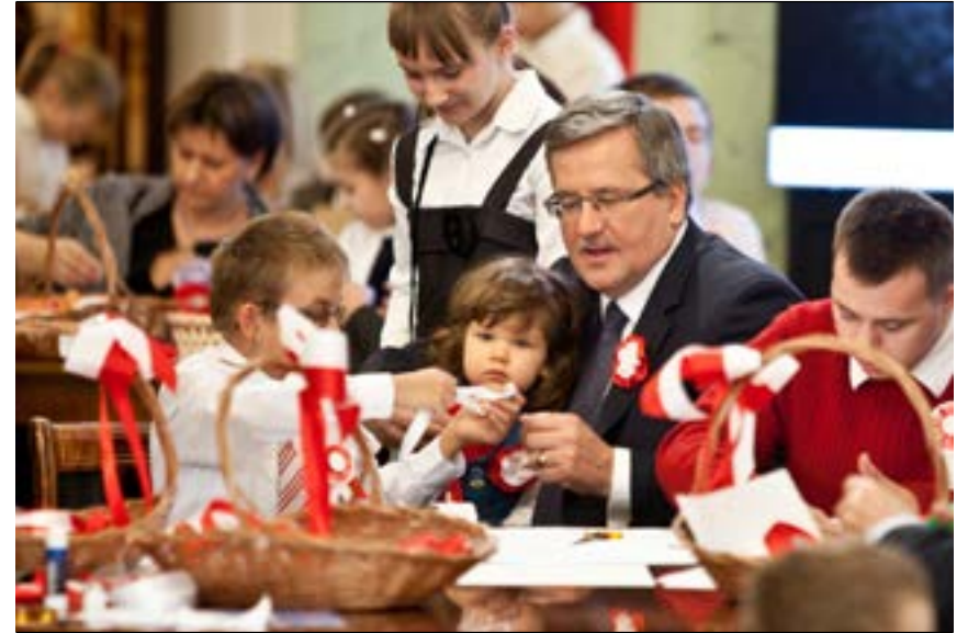
Prezydent wraz z dziećmi podczas wspólnego przygotowywania kokard narodowych, 10 listopada 2012 r.