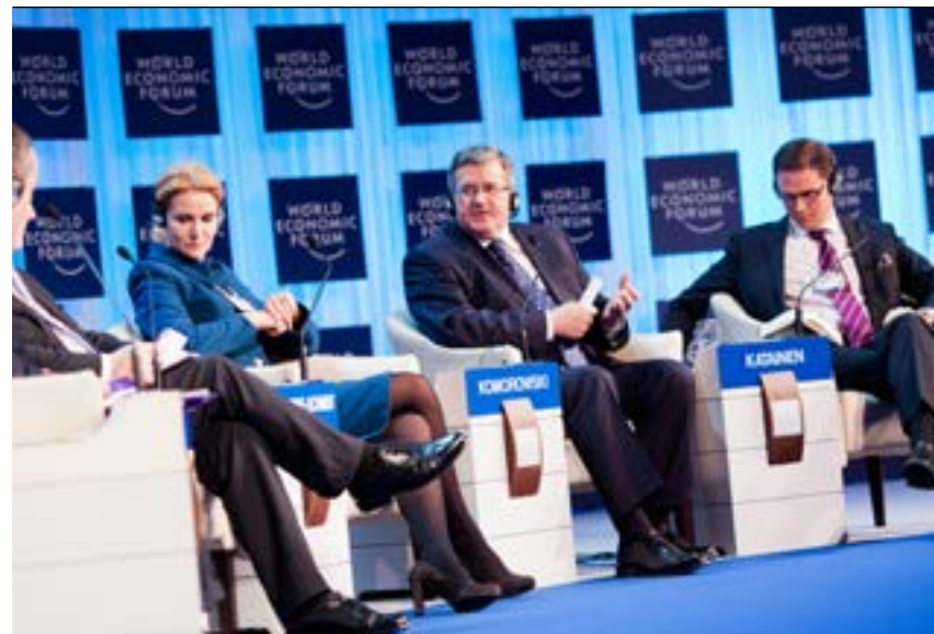
Prezydent RP na Światowym Forum Ekonomicznym w Davos, 26 stycznia 2012 r.