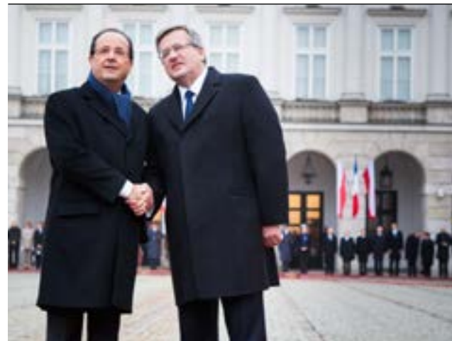
Rozpoczęcie oficjalnej wizyty Prezydenta Francji François Hollande'a w Warszawie, 16 listopada 2012 r.

P olska pełni coraz ważniejszą rolę w Unii Europejskiej, co daje nam szansę na realizowanie naszych interesów w zglobalizowanym świecie. Coraz mocniej zaznaczamy swoją pozycję w gronie państw, których głos szczególnie liczy się w ważnych sprawach dotyczących reform Wspólnoty. Chcemy Unii dynamicznej, coraz bardziej zintegrowanej i otwartej na nowych członków. W zbiegach o tworzenie takiej Unii istotną rolę odgrywają nie tylko stosunki