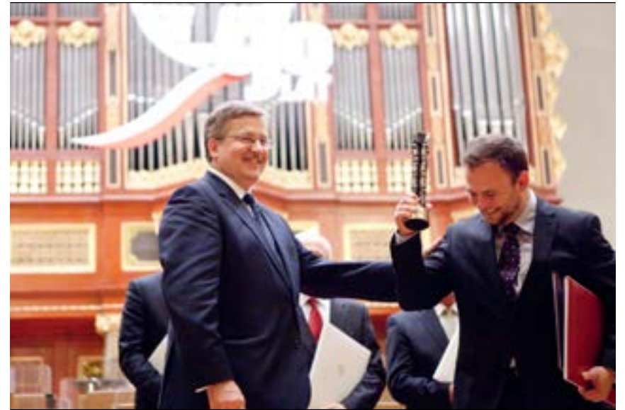
Wręczenie Nagrody Gospodarczej Prezydenta RP, 14 kwietnia 2011 r.