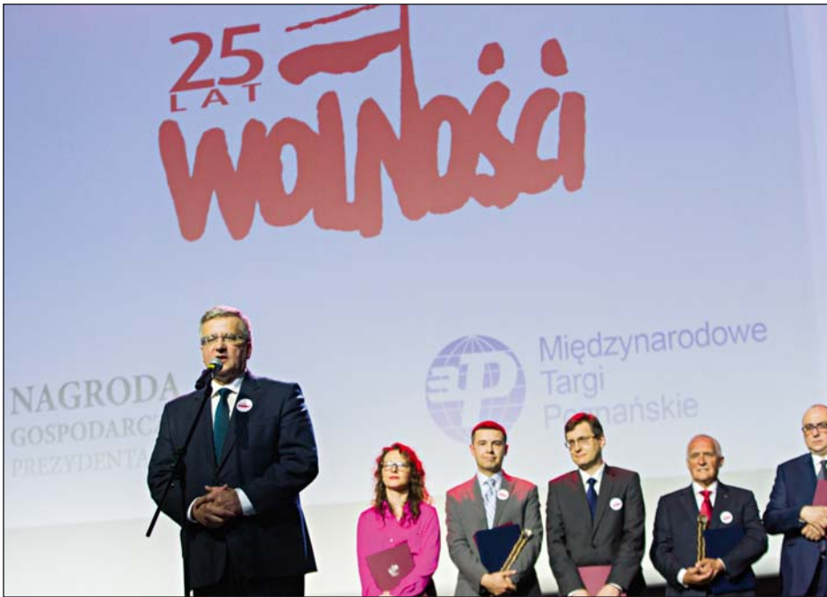
Wręczenie Nagrody Gospodarczej Prezydenta RP, 2 czerwca 2014 r.