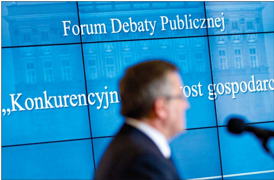
Debata „Konkurencyjność i wzrost gospodarczy Polski”, 24 stycznia 2013 r.

reformowania ładu gospodarczego pod kątem MŚP, potrzebne są m.in. zmiany w systemie podatkowym i Kodeksie pracy. Kancelaria Prezydenta podjęła szereg działań, zmierzających do poprawy funkcjonowania MŚP, które w ogromnej mierze są firmami rodzinnymi – m.in. zgłosiła do Sejmu projekt zmian w ustawie o postępowaniu przed sądami administracyjnymi oraz przedstawiła rekomendacje zawarte w Zielonej Księdze, dotyczące usprawnienia systemu stanowienia prawa.