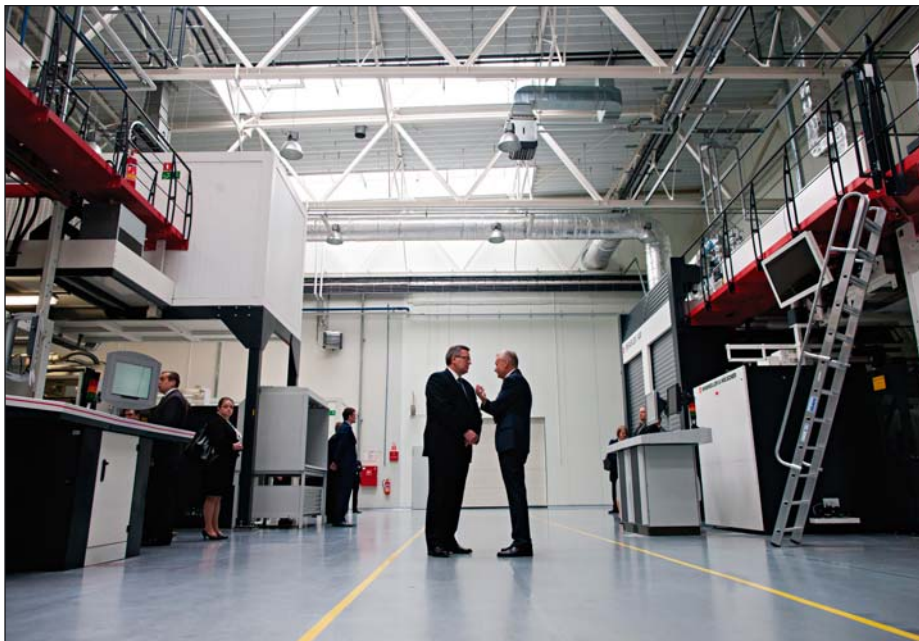
Wizyta Prezydenta RP Bronisława Komorowskiego w województwie kujawsko-pomorskim, 25 kwietnia 2013 r.

nia przedsiębiorców. Ponadto ścisły kontekst gospodarczy miało zorganizowane w kwietniu 2013 r. w Gdańsku „I Polsko-Chińskie Forum Regionalne”.