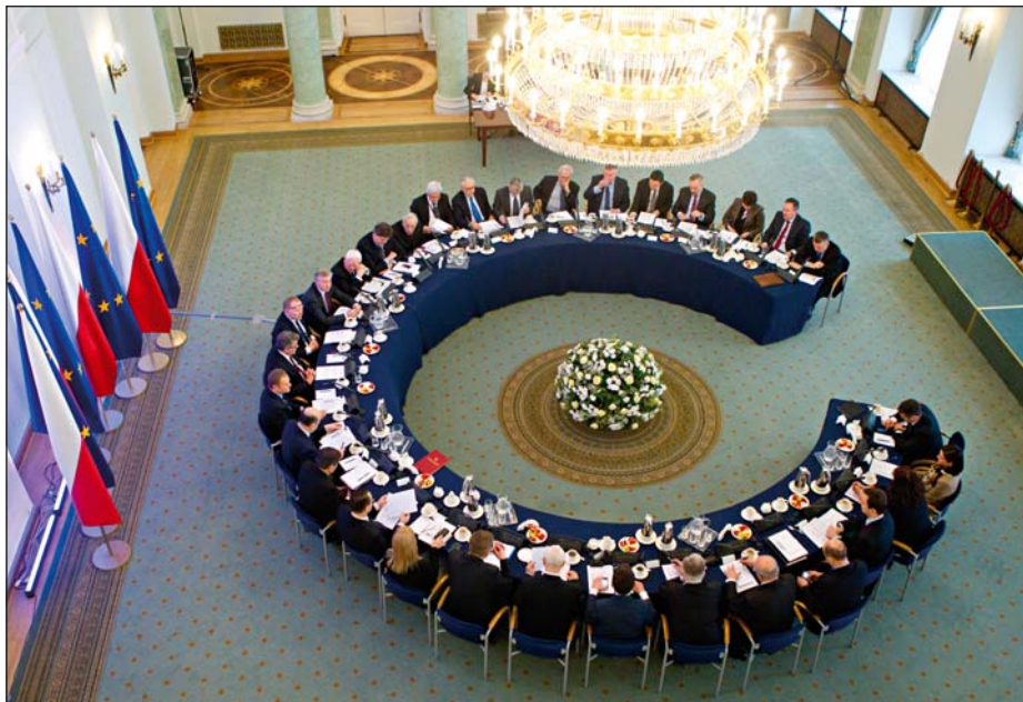
Posiedzenie Rady Gabinetowej, 26 lutego 2013 r.