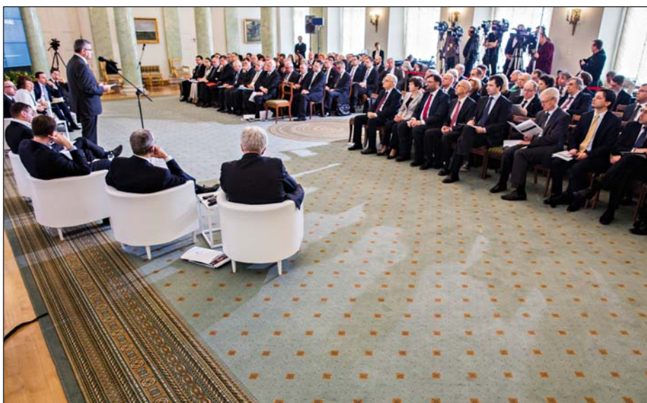
Forum Debaty Publicznej pt. „Gospodarka konkurencyjnej Polski: rekomendacje reform”; prezentacja raportu „OECD Economic Survey of Poland 2014”, Pałac Prezydencki, 10 marca 2014 r.